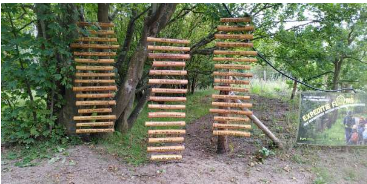
Met dank aan onze sponsors

De publieksinkomsten incl sponsoring bedragen 32% van de inkomsten.